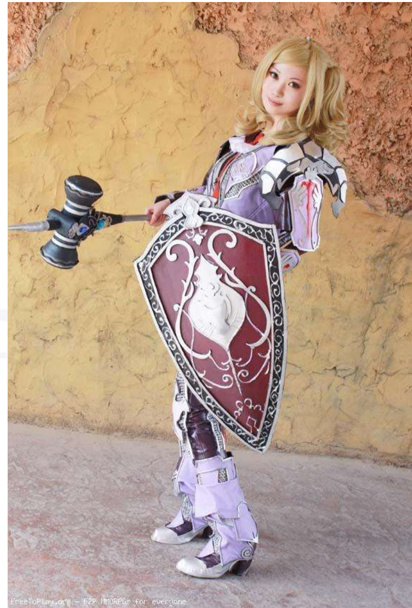
FreeToPlay.org - F2P MMOs for everyone